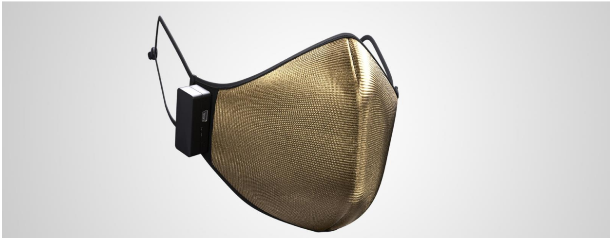
Figur 1: Osmotex Active Sterilising Face Mask®, mit aufgesteckter Batterieeinheit.

Die Entwicklung wird von der Schweizer Regierung durch Innosuisse unterstützt.