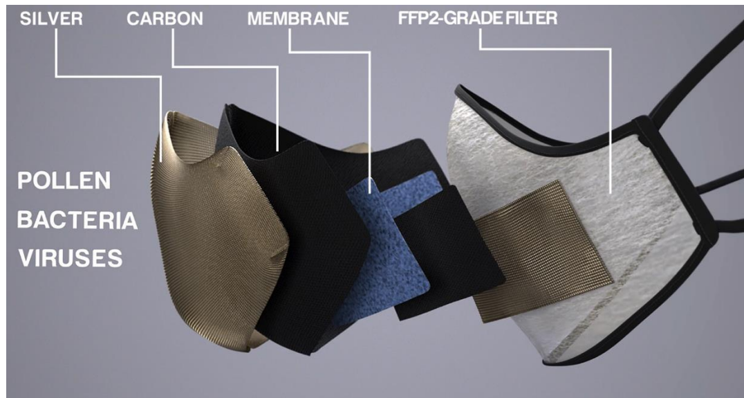
Figure 2: Schichtung der Maske Osmotex Active Sterilising Face Mask®