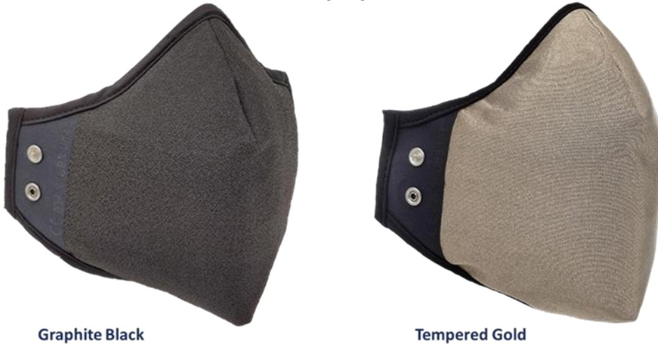
Abbildung 1: Osmotex Active Sterilising Face Mask® verschiedene Farben

Weitere Farben sind für Sonderanfertigungen erhältlich.